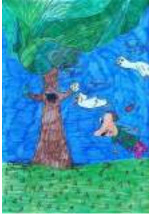
Искра Хипик 5-1