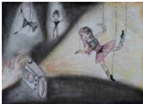
Дуња Шушак 8-4