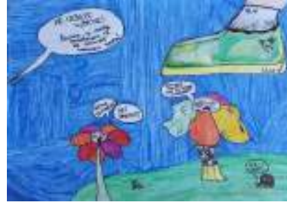
Мила Обреновић 5-1