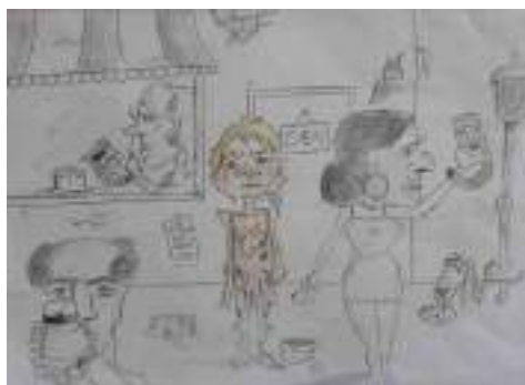
Николета Јокић 8-3