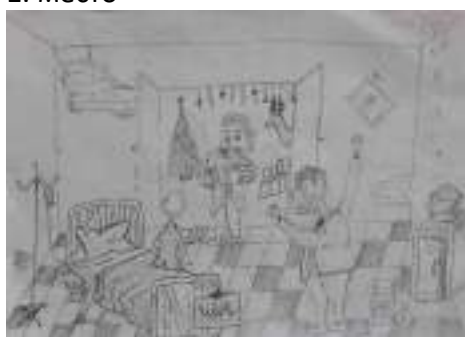
Јована Мићић 8-1