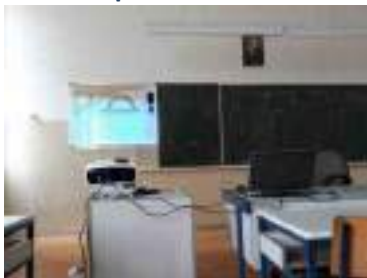
НАСТАВНИЦА ПРАВОСЛАВНЕ ВЕРОНАУКЕ ОПЛЕМЕНИЛА СВОЈ КАБИНЕТ