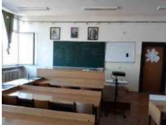
НАСТАВНИЦА МАТЕМАТИКЕ ОПРЕМИЛА СВОЈУ УЧИОНИЦУ ЛИЧНИМ ЛАПТОПОМ И СТОЛИЦОМ